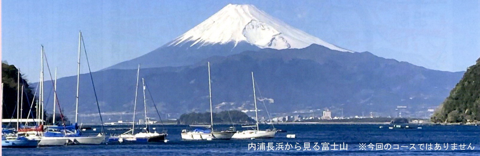
内浦長浜から見る富士山 ※今回のコースではありません

ぬまづ観光ボランティアガイドと一緒に歩き、大地のパワー・溶岩スポットを見て触れてみませんか？