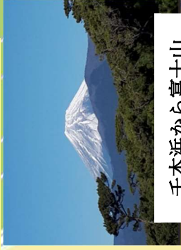
千本浜から富士山